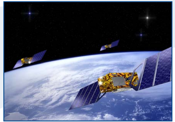
Schweizer Beitrag zur Entwicklung der Galileo-Konstellation, speziell im Bereich der Zeitmessung.